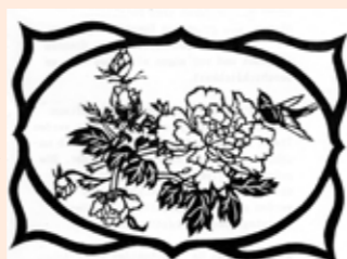
Kirie, japanischer Scherenschnitt.

Iwao Yamaguchi leitet das Origami (Japanische Papierfalttechnik) in der Ausstellung und der Bibliothek Töss. Er wird an einem Kirie (Japanischer Scherenschnitt, der aber mit einem Messer ausgeschnitten wird) arbeiten.