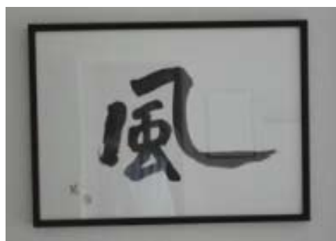
HARU MATSURI FESTIVAL 2011 So.-So. 20.-27. März Winterthur Töss